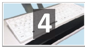
SE ADAPTA EN BANDEJAS Y EN CARROS