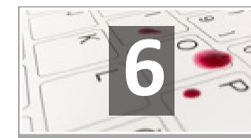
DETECTA SALPICADURAS INFECCIOSAS INMEDIATAMENTE