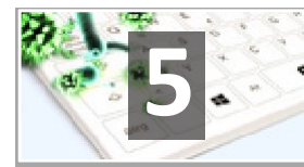
MANTEN LOS GERMENES Y BACTERIAS ALEJADOS