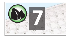
LIBRE DE ANTIMICROBIANOS